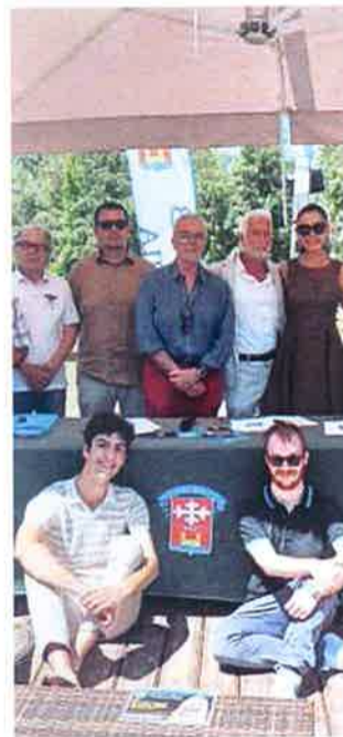
La presentazione della rassegna